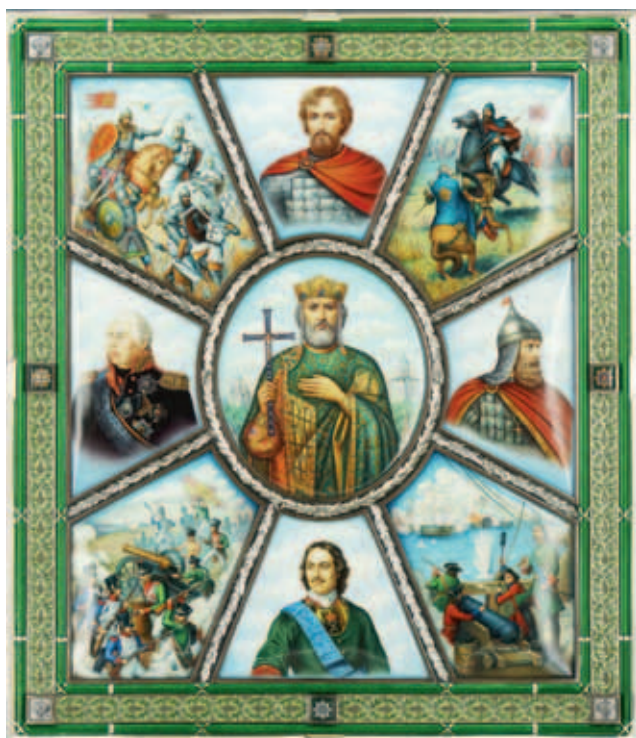
За Русь, за веру. Финифть. г.Ростов Великий