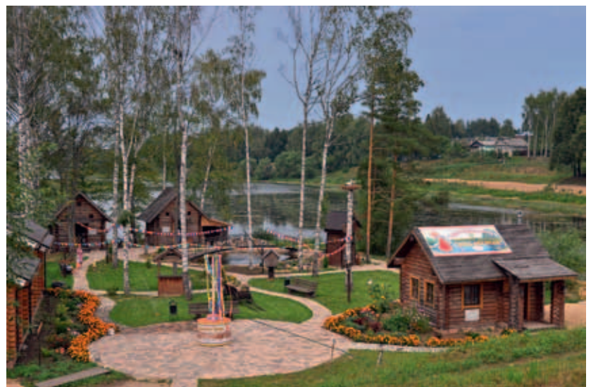
Музей Соль Великая