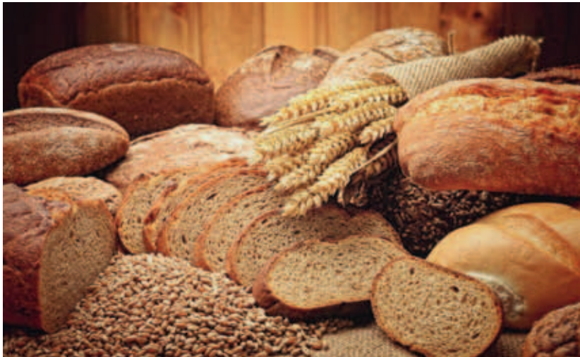
Чувашский хлеб- хура сакар