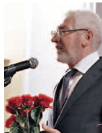
Председатель Ярославского регионального отделения Ассамблеи народов России Нур-Эл Хасиев