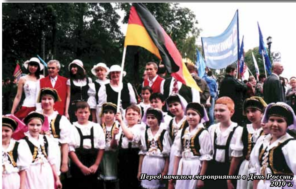
Перед началом мероприятия в День России, 2010 г.