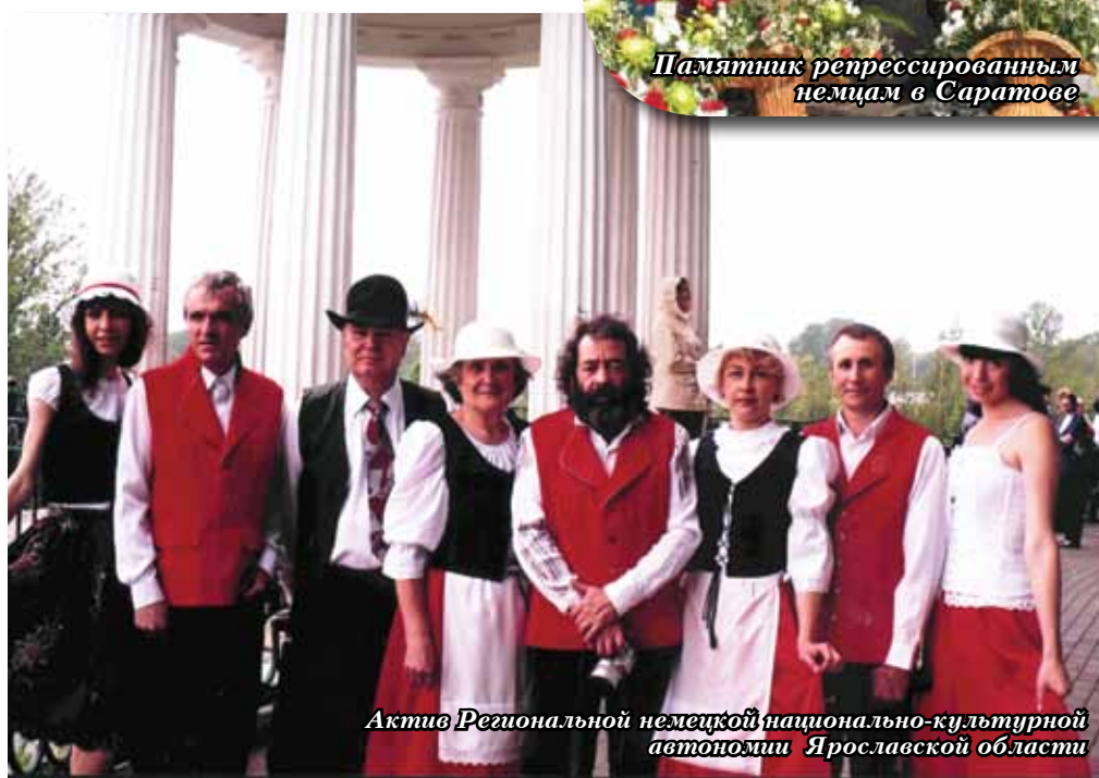
Актив Региональной немецкой национально-культурной автономии Ярославской области