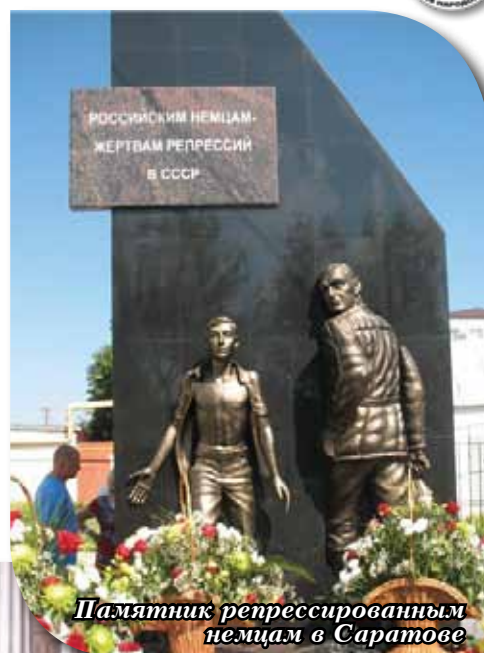
Памятник репрессированным немцам в Саратове

Присутствующие почтили память российских немцев, погибших в результате депортации и жесточайших гонений. Завершением вечера стали песни «Родина» («Хаймат») и «Колокола родины», а также религиозные произведения в исполнении хора «Глокеншпиль».