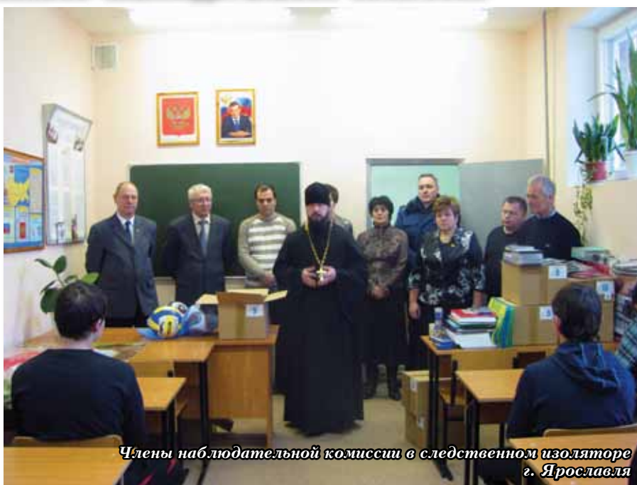
Члены наблюдательной комиссии в следственном изоляторе г. Ярославля

Напомним, комиссия была создана в 2009 году, срок полномочий ее первого состава закончился. В ра-