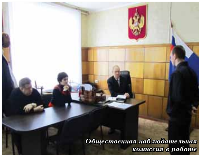
Общественная наблюдательная комиссия в работе

Члены наблюдательной комиссии регулярно бывают в учреждениях УФСИН России по Ярославской области с целью контроля за условиями содержания осужденных, подозреваемых, обвиняемых и подследственных. По итогам проведенной работы материалы о выявленных недостатках направляются Уполномоченному по