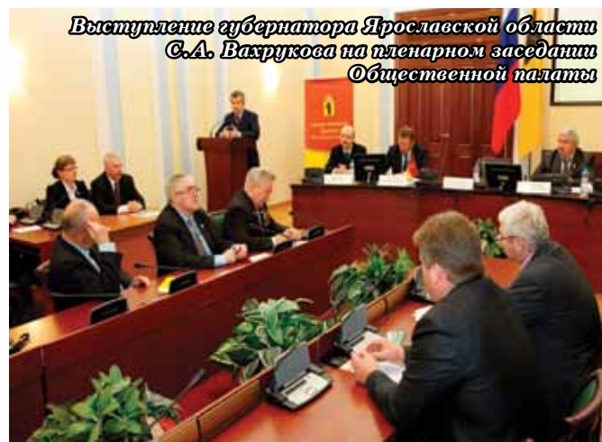
Выступление губернатора Ярославской области С.А. Вахрукова на пленарном заседании Общественной палаты

В своем обращении к членам палаты губернатор области Сергей Алексеевич Вахруков отметил: «Ваши знания и опыт будут определенно востребованы в работе Общественной палаты Ярославской области в целях учета потребностей и интересов жителей региона, защиты их прав и свобод при формировании и реали-