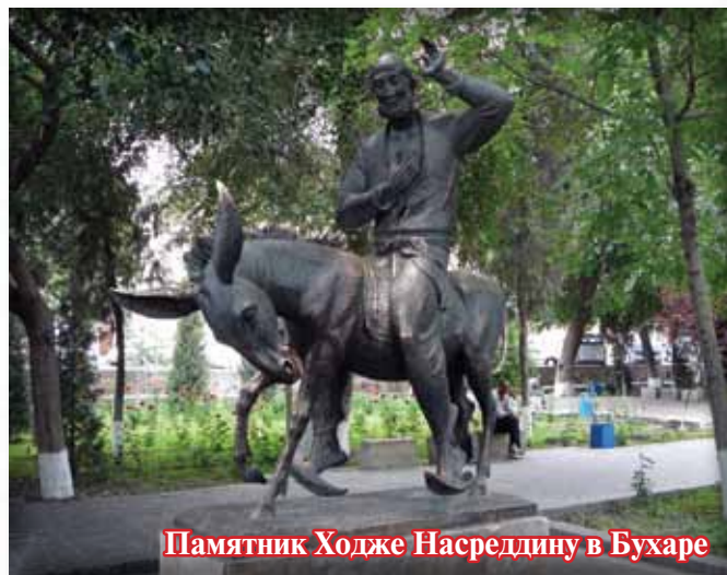
Памятник Ходже Насреддину в Бухаре

Ночью к Насреддину забрались воры. Сколько они ни искали, кроме сундука ничего не нашли. Сундук был очень тяжелым, воры едва дотащили его до каких-то развалин. Когда они, наконец, сорвали крышку сундука, то увидели в нем Насреддина, закрывавшего лицо руками.