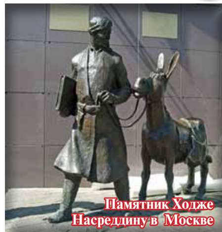
Памятник Ходже Насреддину в Москве