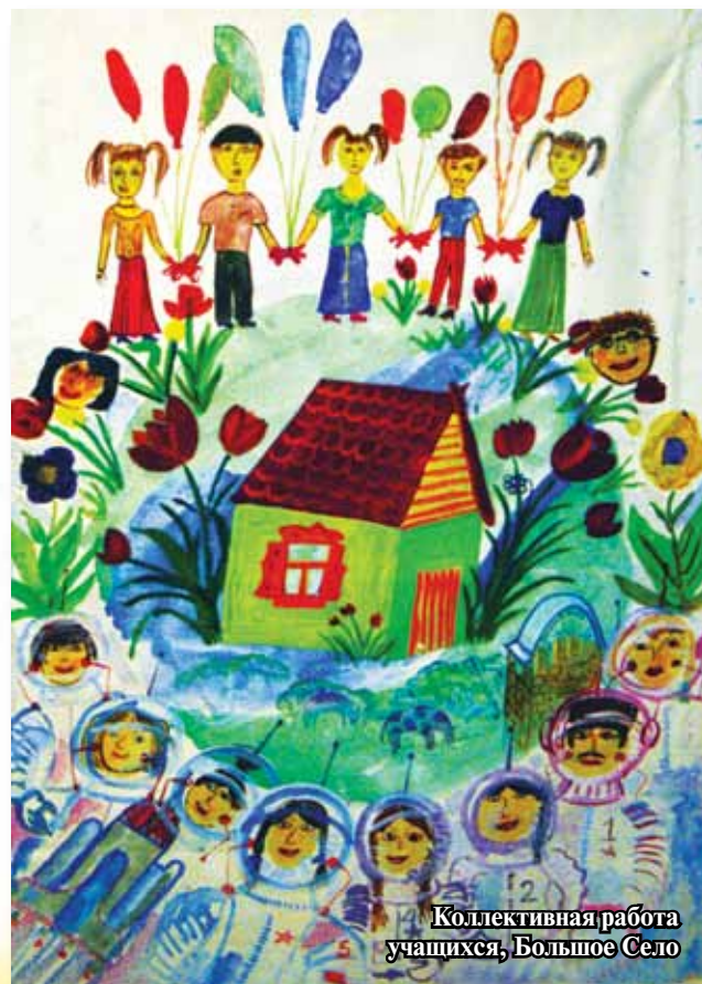
Коллективная работа учащихся, Большое Село