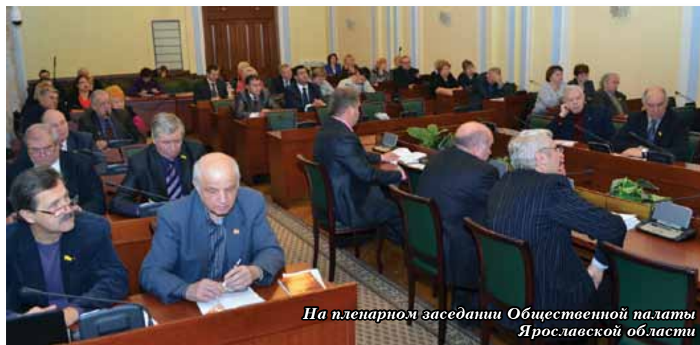
На пленарном заседании Общественной палаты Ярославской области

Первое пленарное заседание в новом составе Общественная палата проведёт в первом квартале 2011 года после 20 февраля, когда закончится срок полномочий действующего состава.