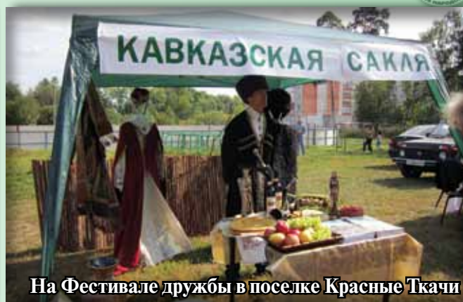
На Фестивале дружбы в поселке Красные Ткачи

обходимой для решения многих важных задач по стабилизации межнациональных отношений.