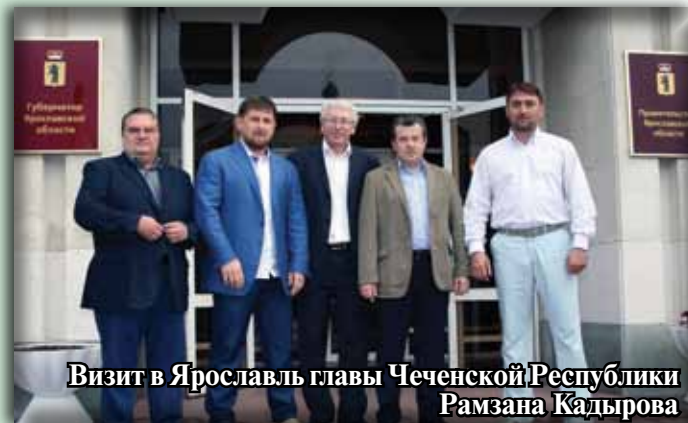
Визит в Ярославль главы Чеченской Республики Рамзана Кадырова

Начнем со статистики. В Ярославской области проживает более двух тысяч вайнахов, хотя по данным переписи населения 2002 года, численность чеченцев в Ярославской области составляла 989 человек, а ингушей – 511