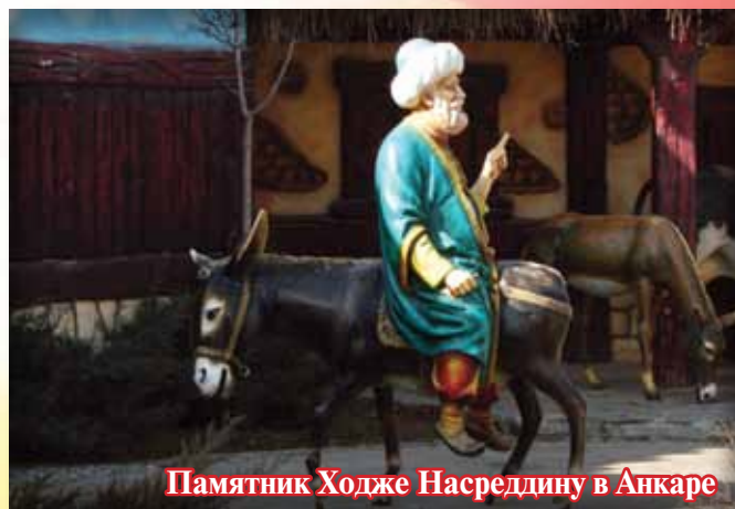
Памятник Ходже Насреддину в Анкаре