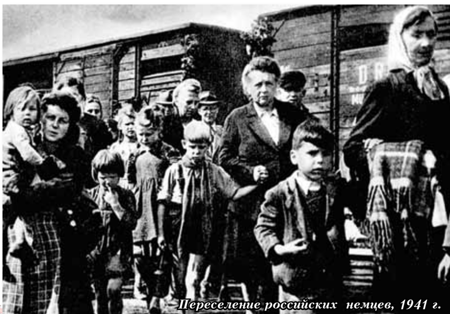
Переселение российских немцев, 1941 г.

Указ Президиума Верховного Совета СССР «О переселении немцев, проживающих в районах Поволжья» содержал обвинения населения советской Автономии немцев Поволжья в пособничестве «многочисленным шпионам и диверсантам», якобы засланым гитлеровцами. Депортация состоялась 3 – 20 сентября 1941 года. Имущество переселенцев конфисковали, отчего крова были лишены 363 тысяч советских немцев, жизни многих из которых унесла первая же зима, ведь на новом месте людей зачастую выгружали из эшелонов в голую степь.