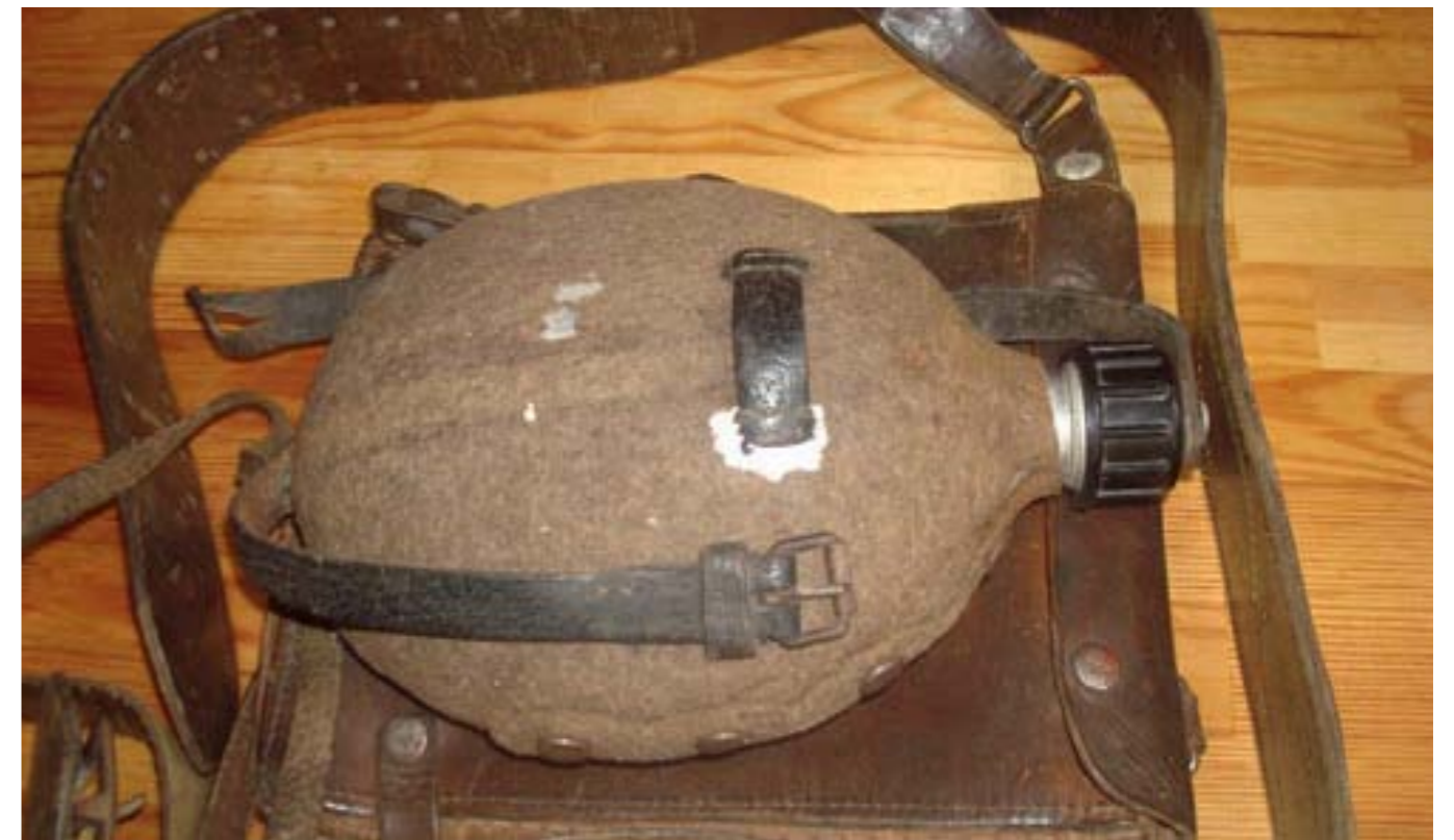
Реликвия – это вещь, свято хранимая как память о прошлом.