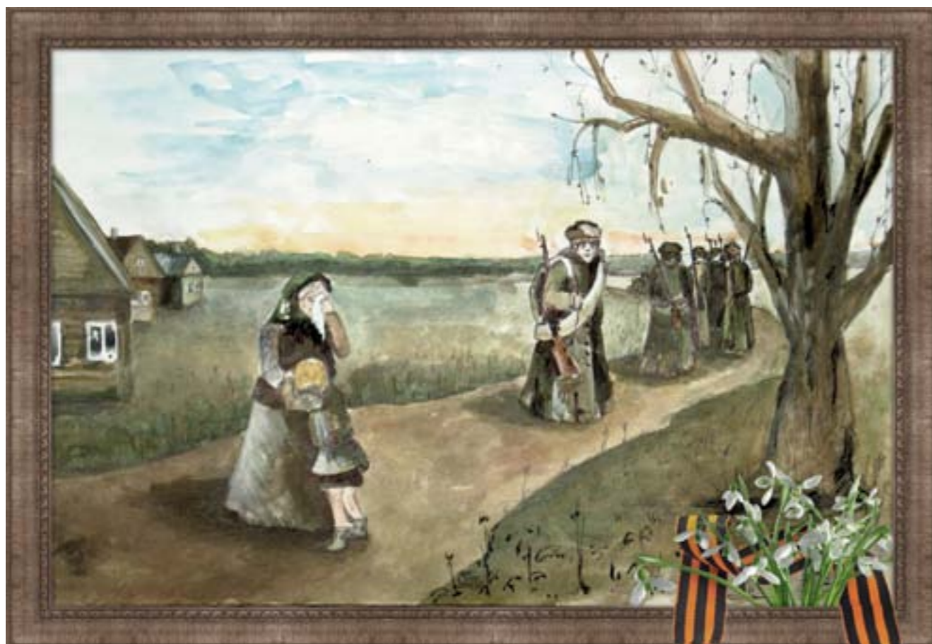
Путь дорога фронтовая Евгения Фролова